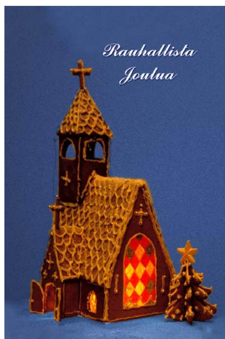
Ohje: Finfood Keittokirja / Johanna Häkkinen